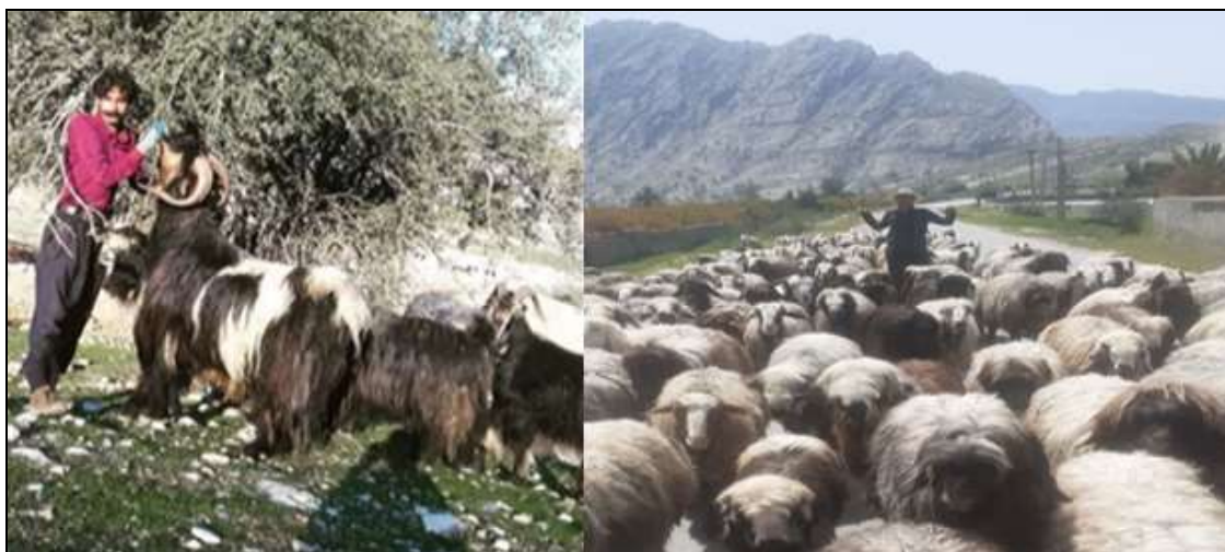
شکل (۵) دامداری در عشایر ایمان‌لو

عشایر ایمان‌لو در پرورش دام تخصص دارند و از موهبت طبیعی مراتع مطلوب منطقه چشمه‌رحمان به‌خوبی بهره می‌گیرند. عمده دامداری این گروه، پرورش گوسفند است و به‌لحاظ نژاد دامی، دام این منطقه جز نژادهای مطلوب شناخته شده است. نژاد بز ایمان‌لو از نژادهای شهره در ایل بختیاری و قشقایی است و نژاد آن در حال تکثیر است، اما گوسفندها اغلب از نژاد ترکی و بختیاری هستند و