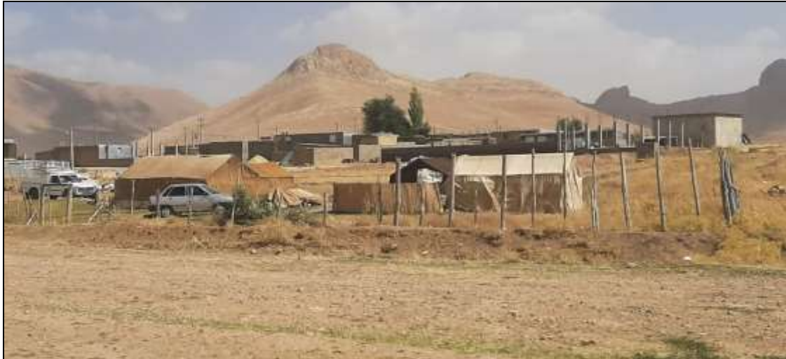
شکل (۱) نمایی از محل سکونت عشایر ایمان‌لو