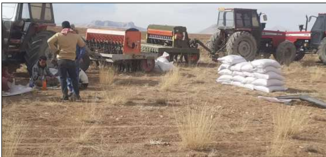
شکل (۳) همیاری در بین عشایر ایمان‌لو در کشاورزی

به عنوان نمونه، سه برادر که در سه خانواده زیستی جداگانه هستند، اما در یک سکونتگاه زندگی می‌کنند، در مدیریت امر تحصیل فرزندان، کشاورزی و دامداری، به‌اختیار و به‌صورت منعطف تفکیک وظیفه می‌نمایند (شکل ۳): به‌نحوی که سرپرست یکی از خانواده‌های زیستی (برادر الف) مسئولیت احشام، چرا و کوچ سه خانواده را به عهده می‌گیرد. برادر (ب) نیز در عین همکاری در امور کشاورزی و دامداری به‌طور خاص سرپرست فرزندان دانش‌آموز هر سه خانواده شده و در منزلگاه بیلاقی می‌مانند و برادر (ج) هم امور کشاورزی و تأمین علوفه را بر عهده می‌گیرد و پس