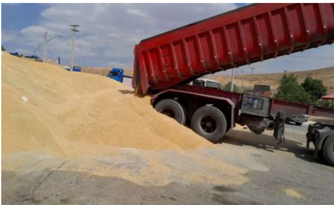
شکل (۴) برداشت و دپوی گندم در عشایر ایمان‌لو

در بیشتر مناطق، میانگین برداشت گندم دو تُن در هر هکتار بوده، اما در این منطقه، میانگین